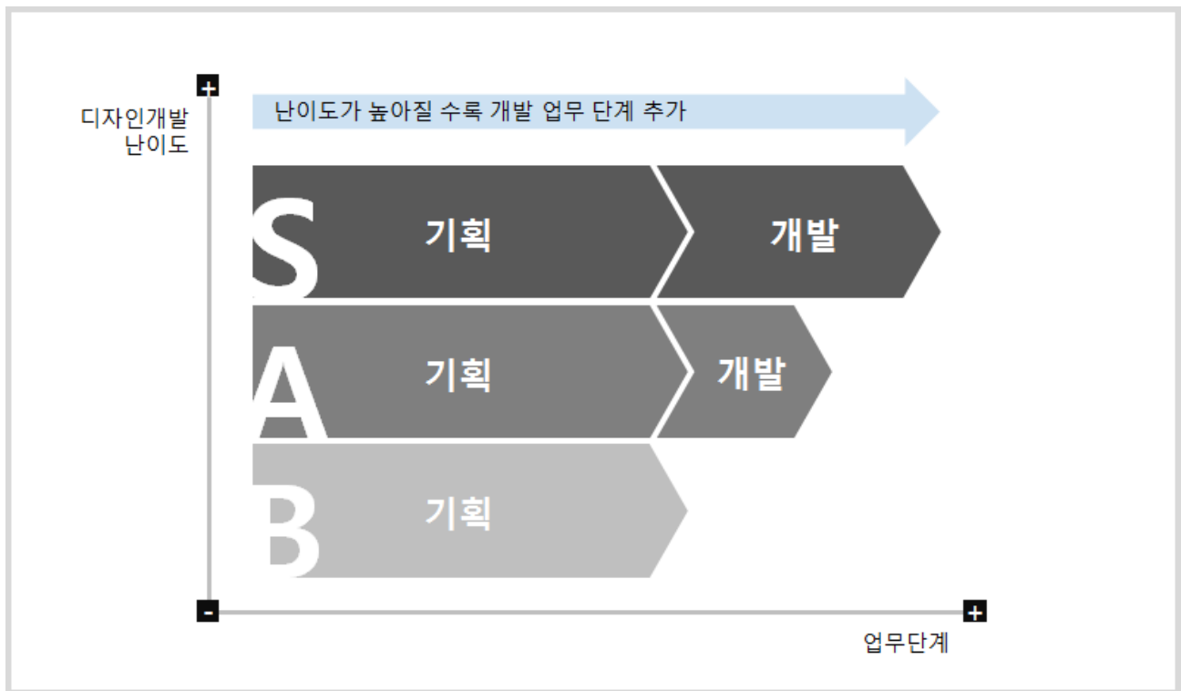
그림 2. 서비스·경험디자인 분야 난이도 관계

서비스·경험디자인은 소비자에게 매력적인 서비스 경험을 제공하기 위해 디자인 기획 단계에서 다각적인 조사 및 분석을 진행하여야 하며, 모든 난이도에서 업무 단계 및 업무량(품셈)이 동일하게 수행된다. 또한, 개발 목표 및 범위에 따라 수행해야 하는 디자인개발 업무 단계가 결정되며, 이를 도식화하면 아래와 같다.